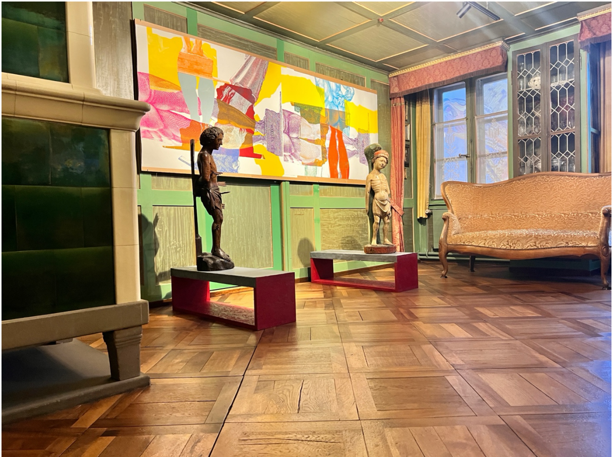
Das «Grüne Zimmer» bzw. die vordere Stube des Dolderhauses mit einer Inszenierung von Pia Fries.

An dieser Stelle sei auch allen Spenderinnen und Spendern des Dolderhauses, die nicht teilnehmen konnten, herzlich gedankt. Mit ihrer Unterstützung leisten sie einen wesentlichen Beitrag für den Unterhalt des Hauses, die Konservierung der kostbaren Sammlung und die verschiedenen Aktivitäten.