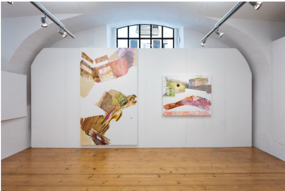
Der Dolderkeller mit Bildern von Pia Fries.

An der Vernissage vom 10. Oktober 2025 waren über 200 Personen anwesend. Auch das Schweizer Fernsehen SRF war mit der Moderatorin Sabine Dahinden Carrel vor Ort und berichtete live in der Sendung Schweiz aktuell vom Anlass. Diese Ausstrahlung und die weitere ausführliche Berichterstattung in der Luzerner Zeitung , im Regionaljournal Zentralschweiz von Radio SRF und dem Anzeiger Michelsamt brachten zahlreiche Besucherinnen und Besucher von nah und fern nach Beromünster.