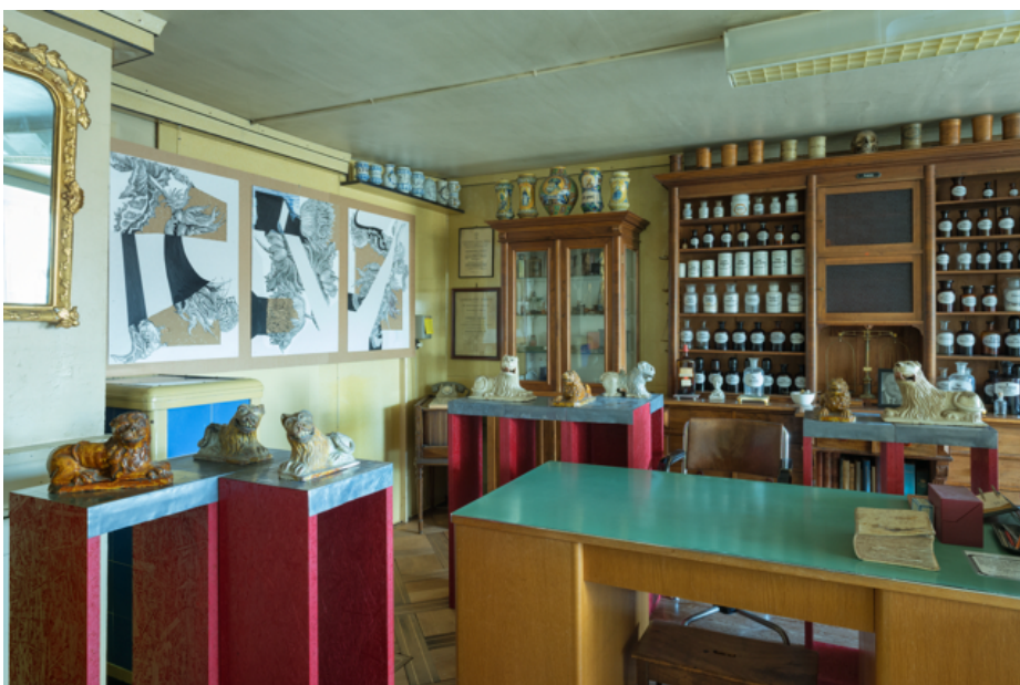
Das zur «Löwen-Apotheke» umgestaltete Sprechzimmer.